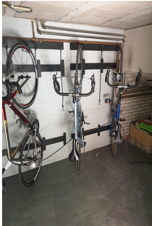
Foto 2 gerepareerde fietsen