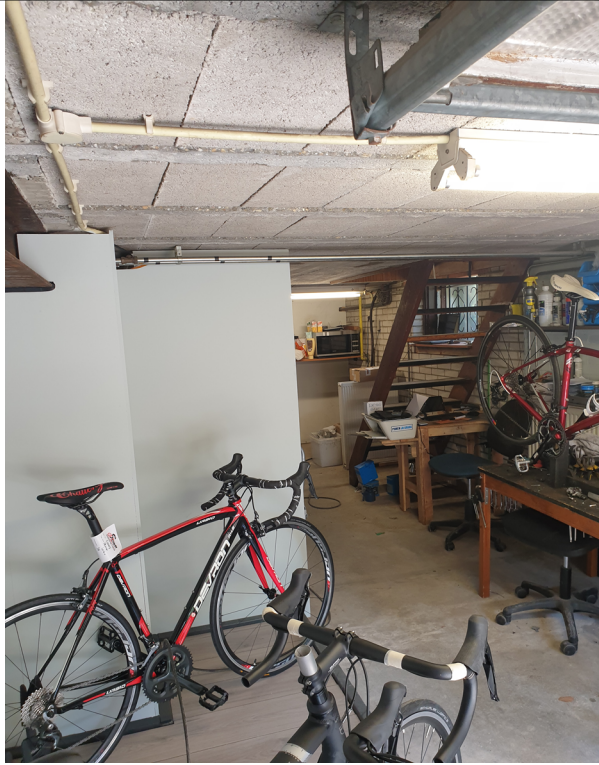
Foto 5, werkplek