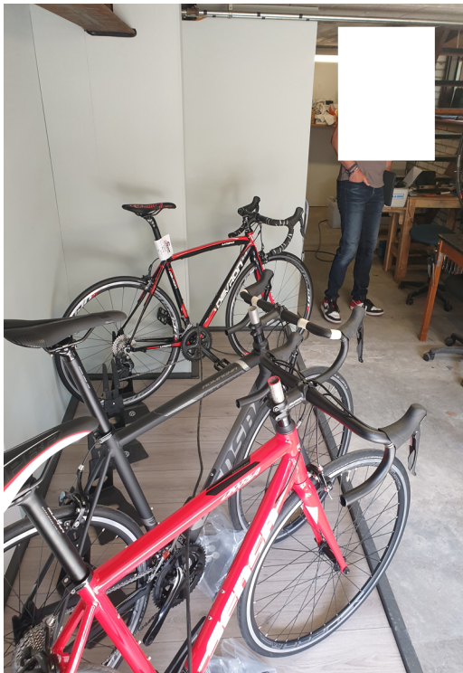
Foto 3, opslag nieuwe fietsen ter verkoop